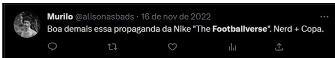
Figura 3 – comentário de Murilo

Ou o comentário de Murilo, Figura 3: “Boa demais essa propaganda da Nike “The Footballverse”. Nerd + Copa”.