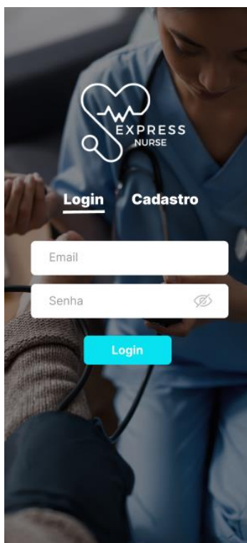
Figura 1: Tela de login

Representado na figura 5, está a tela dos serviços oferecidos, o usuário cliente poderá selecionar conforme a sua necessidade, os serviços selecionados irão para o carrinho de compra, em seguida o usuário finaliza a compra escolhendo sua forma de pagamento. O app irá buscar os profissionais que estão disponíveis em um raio de 3km; na figura 6, a tela dos profissionais que estão disponíveis na região, o cliente poderá escolher o profissional conforme a sua descrição, especializações, avaliação de outros clientes. Ele poderá selecionar quantos quiser, o que aceitar a solicitação primeiro, irá prestar o serviço.