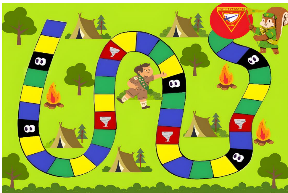
Figura1: Tabuleiro do jogo 70x7

O tabuleiro tem um formato retangular, com um design de acampamento dos desbravadores, composto por 39 casas. Há muitas figuras ilustrativas, retratando o ambiente de acampamento e objetos representativos aos desbravadores.