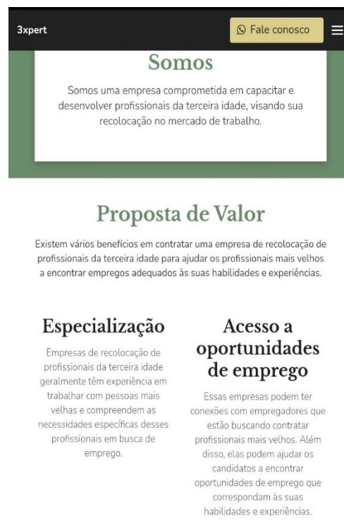
Figura 2: Interface da tela inicial de nosso site.