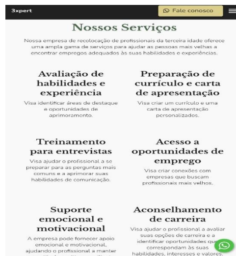
Figura 4: Serviços prestados ofertados 3xpert.