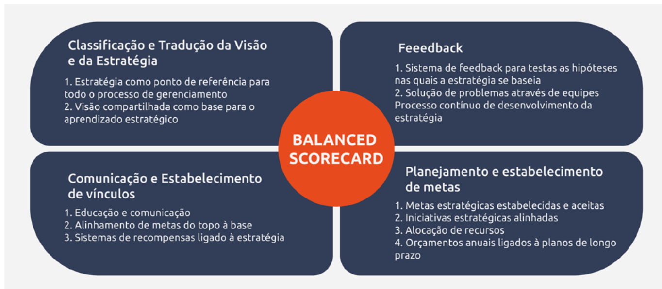
Figura 2 – O Balanced Scorecard como Estrutura para Ação Estratégica Fonte: KAPLAN & NORTON, 1997, p. 12.

A síntese do que foi dito por Kaplan e Norton pode é observada na figura 2.